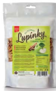
Ovesné celozrnné lupínky s jablky a skořicí

hmotnost: 30 g / karton: 30 ks PN 0561100