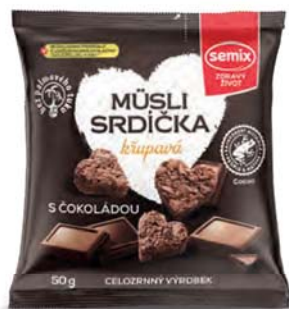
Müsli srdíčka křupavá s čokoládou

hmotnost: 50 g / karton: 15 ks PN 0671700