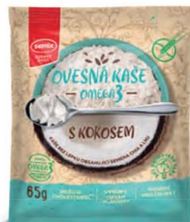
Ovesná omega-3 kaše s kokosem

hmotnost: 65 g / karton: 22 ks PN 0553200