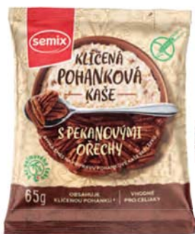
Pohanková kaše s pekanovými ořechy

hmotnost: 65 g / karton: 22 ks PN 0552800