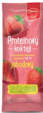
Proteinový koktejl jahodový

hmotnost: 30 g / karton: 36 ks PN 0770600