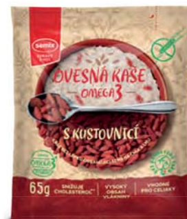
Ovesná omega-3 kaše s kustovnicí

hmotnost: 65 g / karton: 22 ks PN 0355400