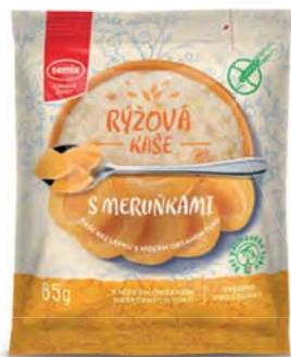
Rýžová kaše s meruňkami

hmotnost: 65 g / karton: 22 ks PN 0550900