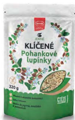
KLÍČENÉ pohankové lupínky

hmotnost: 250 g / karton: 6 ks PN 0790200