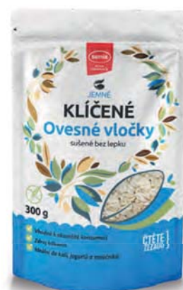
KLÍČENÉ ovesné vločky

hmotnost: 220 g / karton: 6 ks PN 0790600