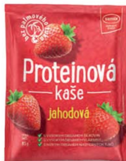
Proteinová kaše jahodová sypká směs

hmotnost: 65 g / karton: 22 ks PN 0352400