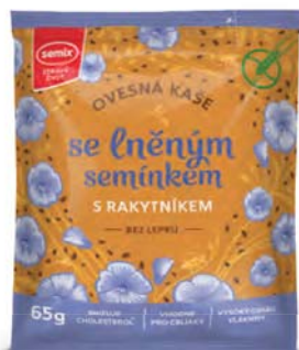
Ovesná kaše se lněným semínkem a rakytníkem

hmotnost: 65 g / karton: 22 ks PN 0553300