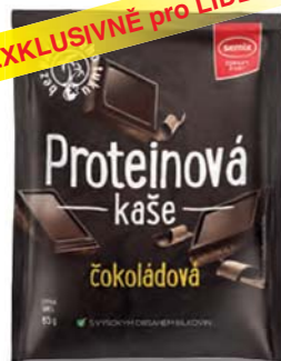
Proteinová kaše čokoládová

hmotnost: 65 g / karton: 22 ks PN 0354200