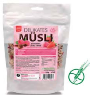
Delikates müsli s červeným ovocem

hmotnost: 200 g / karton: 6 ks PN 0561100