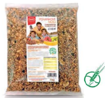
Pohankové müsli s amarantem

hmotnost: 320 g / karton: 6 ks PN 0550200