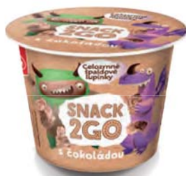
Snack2Go – špaldové celozrnné lupínky s čokoládou, v praktickém kelímku, jednorporcové

hmotnost: 450 g / karton: 8 ks PN 0556500