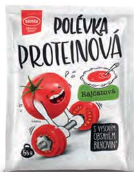
Proteinová polévka rajčatová

hmotnost: 55 g / karton: 22 ks PN 0770900