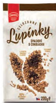
Špaldové celozrnné lupínky s čokoládou

hmotnost: 300 g / karton: 6 ks PN 0561200