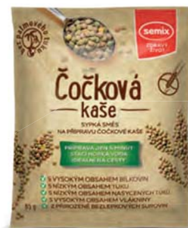
Čočková kaše – naslano, vhodná na odpolední svačinu či večeři

hmotnost: 65 g / karton: 22 ks PN 0551500