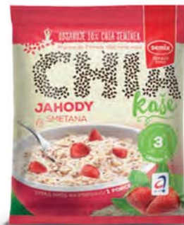
Ovesná chia kaše jahody a smetana

hmotnost: 65 g / karton: 22 ks PN 0552700