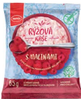
Rýžová kaše s malinami

hmotnost: 65 g / karton: 22 ks PN 0550900