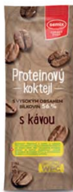
Proteinový koktejl s kávou

hmotnost: 30 g / karton: 36 ks PN 0770400