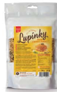
Ovesné celozrnné lupínky s medem a semínky

hmotnost: 220 g / karton: 6 ks PN 0561000