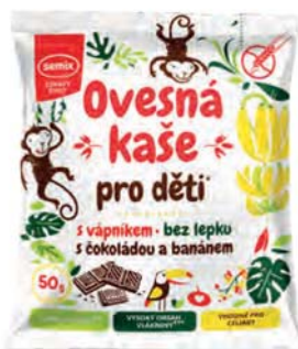
Ovesná kaše pro děti s vápníkem, čokoládou a banánem

hmotnost: 65 g / karton: 22 ks PN 0355200