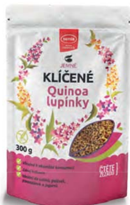
KLÍČENÉ quinoa lupínky

Smíchejte klíčené ovesné vločky a klíčené quinoa lupínky, vlašské ořechy a ovoce dle chuti. Přidejte jogurt, zakysanou smetanu nebo mléko pokojové teploty.