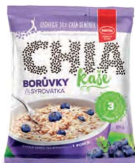
Ovesná chia kaše borůvky a syrovátka

hmotnost: 65 g / karton: 22 ks PN 0352200