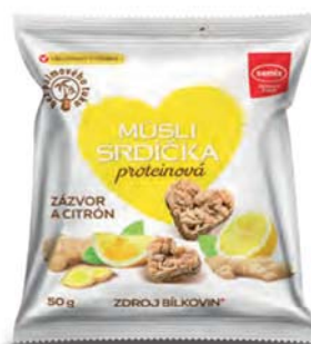
Müsli srdíčka proteinová zázvor a citrón

hmotnost: 100 g / karton: 12 ks PN 0676600