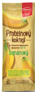
Proteinový koktejl banánový

hmotnost: 30 g / karton: 36 ks PN 0770100