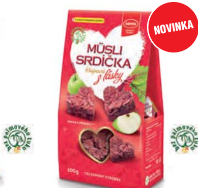
Müsli srdíčka křupavá z lásky

hmotnost: 50 g / karton: 15 ks PN 0673000