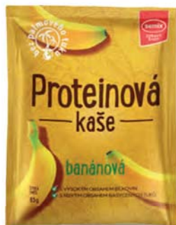
Proteinová kaše banánová sypká směs

hmotnost: 65 g / karton: 22 ks PN 0352400