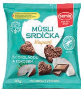
Müsli srdíčka křupavá s čokoládou a kokosem

hmotnost: 100 g / karton: 7 ks PN 0671700