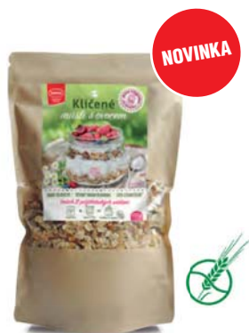
Klíčené müsli s ovocem

hmotnost: 450 g / karton: 8 ks PN 0556500