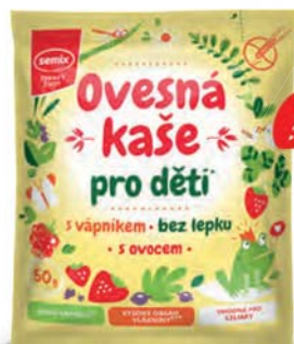
Ovesná kaše pro děti s vápníkem, čokoládou a banánem

hmotnost: 50 g / karton: 22 ks PN 0554700