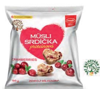
Müsli srdíčka proteinová s americkou brusinkou

hmotnost: 50 g / karton: 12 ks PN 0676000