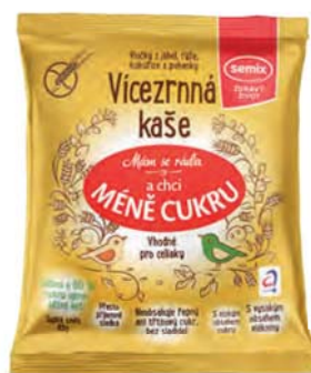
Vícezrnná kaše – z jáhel, rýže, kukuřice a pohanky

hmotnost: 65 g / karton: 22 ks PN 0353100