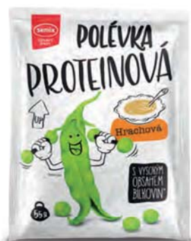
Proteinová polévka hrachová

hmotnost: 55 g / karton: 22 ks PN 0770900