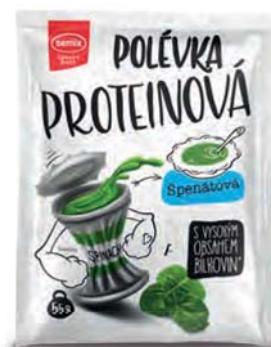
Proteinová polévka špenátová

hmotnost: 55 g / karton: 22 ks PN 0770700