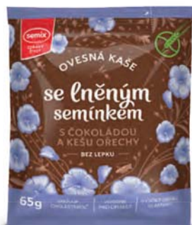
Ovesná kaše se lněným semínkem, čokoládou a kešu oříšky

hmotnost: 65 g / karton: 22 ks PN 0553300