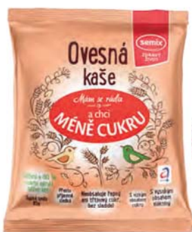
Ovesná kaše natural

hmotnost: 65 g / karton: 22 ks PN 0353100