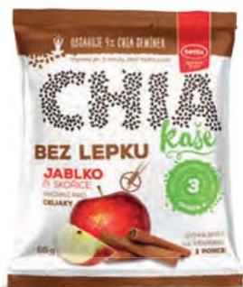
Chia kaše jablko a skořice

hmotnost: 65 g / karton: 22 ks PN 0552700