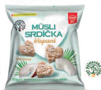
Müsli srdíčka křupavá kokosová

hmotnost: 50 g / karton: 15 ks PN 0671600