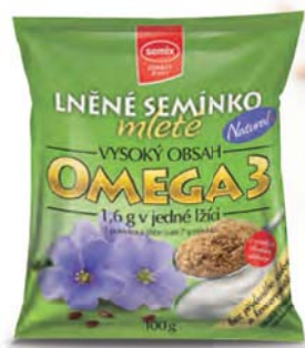
Lněné semínko mleté natural

hmotnost: 150 g / karton: 10 ks PN 0535000