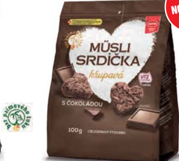
Müsli srdíčka křupavá s čokoládou

hmotnost: 50 g / karton: 15 ks PN 0671700