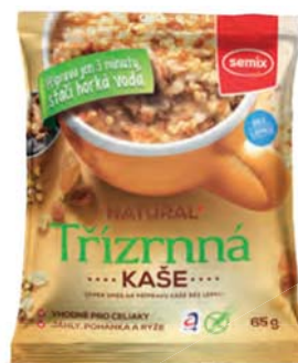
Třízrnná kaše natural – z jáhel, rýže a pohanky

hmotnost: 65 g / karton: 22 ks PN 0551600