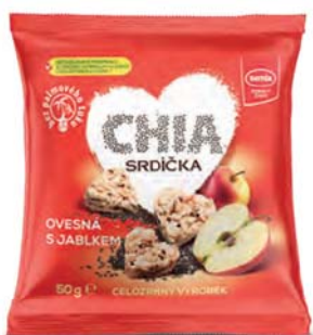
Chia srdíčka ovesná s jablkem

hmotnost: 50 g / karton: 15 ks PN 0673400