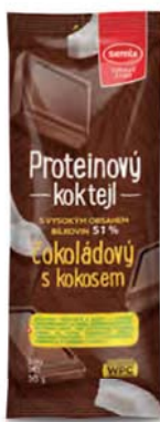
Proteinový koktejl čokoládový s kokosem

hmotnost: 30 g / karton: 36 ks PN 0770100