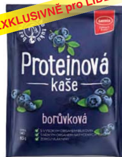
Proteinová kaše borůvková

hmotnost: 65 g / karton: 22 ks PN 0354300