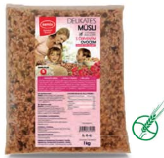
Delikates müsli s červeným ovocem

hmotnost: 320 g / karton: 6 ks PN 0550200