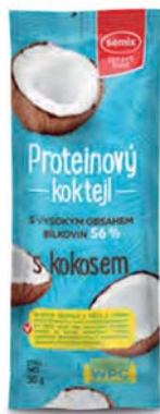
Proteinový koktejl s kokosem

hmotnost: 30 g / karton: 36 ks PN 0770500