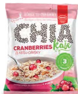
Vícezrná chia kaše cranberries a kešu oříšky

hmotnost: 65 g / karton: 22 ks PN 0352200