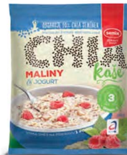
Ovesná chia kaše maliny a jogurt

hmotnost: 65 g / karton: 22 ks PN 0354000