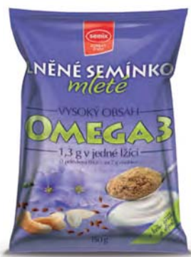
Lněné semínko mleté s kešu oříšky a dýní

hmotnost: 150 g / karton: 10 ks PN 0535000