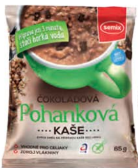
Pohanková kaše čokoládová

hmotnost: 65 g / karton: 22 ks PN 0552800