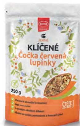
KLÍČENÉ čočka červená lupínky

hmotnost: 300 g / karton: 6 ks PN 0790100