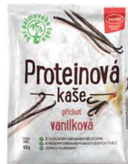
Proteinová kaše s příchutí vanilky

hmotnost: 65 g / karton: 22 ks PN 0352300